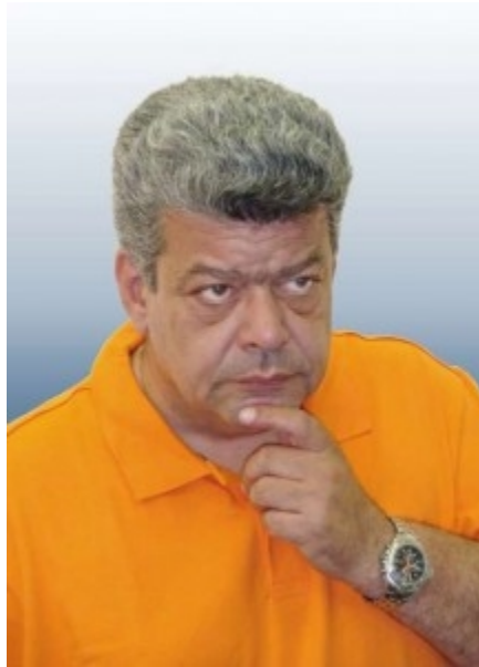
Το νέο βιβλίο του καθηγητού κ. Ιωάννη Μάζη